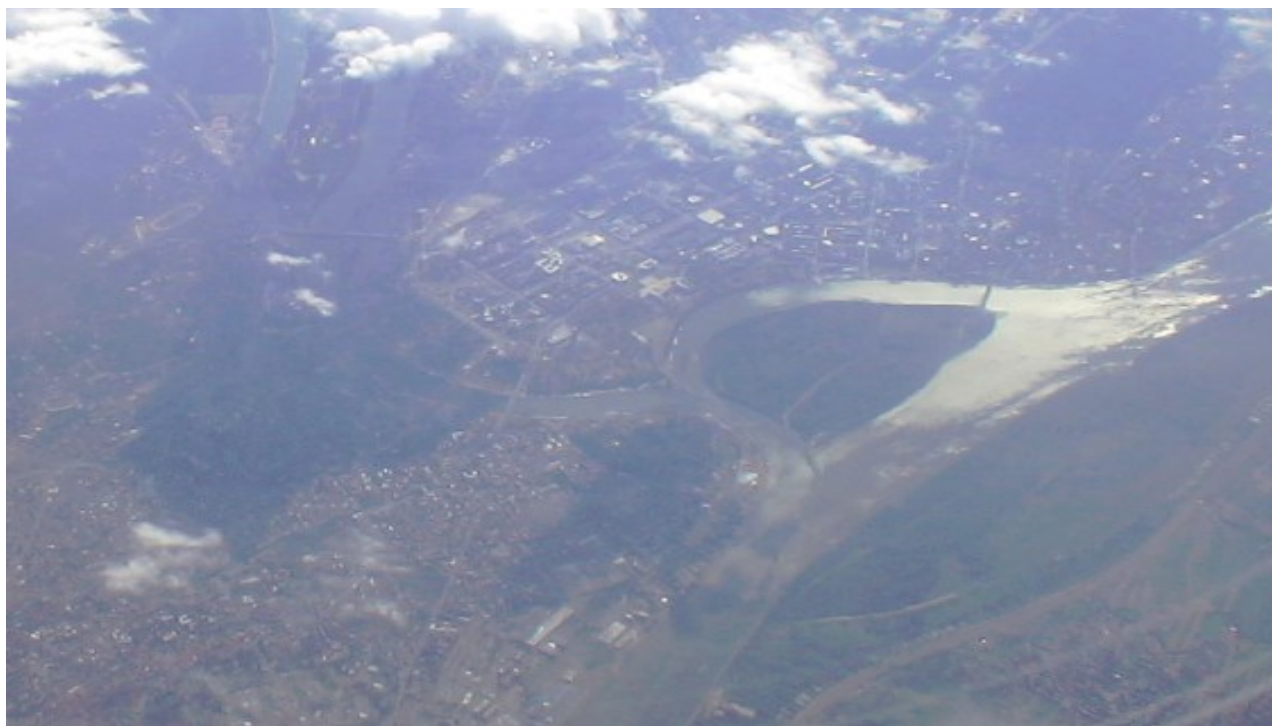
Letecký pohled na Bělehrad a Zemun, foto pořízeno v srpnu 2012.