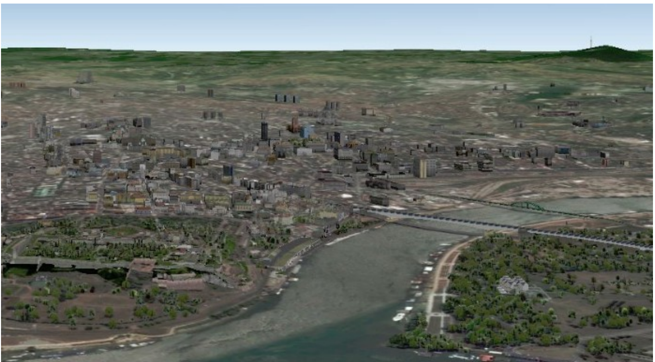
Pohled na Sávu od severu, vojska Trojspolku postupovala zprava doleva.