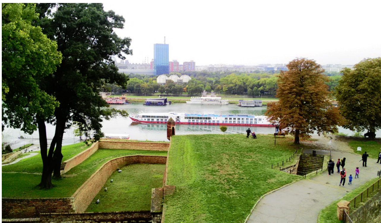
Pohled pořízený z pozic, ze kterých bránila srbská armáda překonání Sávy.